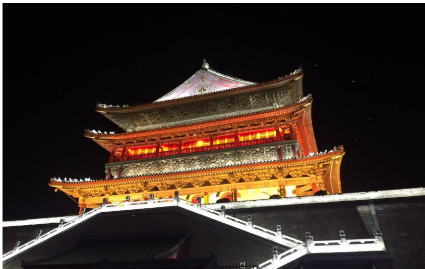
(陝西省西安大唐建築)